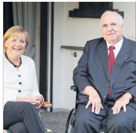
«MEIN MÄDCHEN» CDU-Kanzler unter sich: Angela Merkel mit Amtsvorgänger Kohl in dessen Haus in Ludwigshafen-Oggersheim im August 2009.