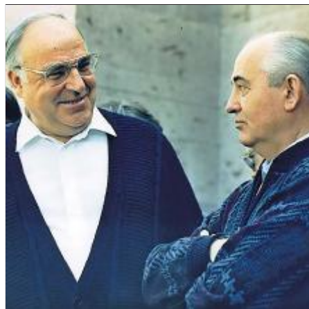
WIEDERVEREINIGUNG «Der Rhein sucht seinen Weg – wie die deutsche Einheit.» Kohl überzeugt den sowjetischen Führer Michail Gorbatschow.