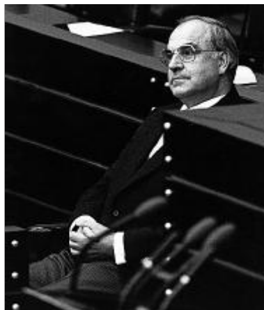
LEBENSZIEL ERREICHT Der neu gewählte Kanzler sitzt auf der Regierungsbank des Bundestages am 1. Oktober 1982.