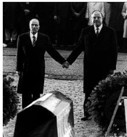
VERSÖHNUNG Am 22. September 1984 ergreift der französische Präsident François Mitterrand in Verdun spontan Helmut Kohls Hand.