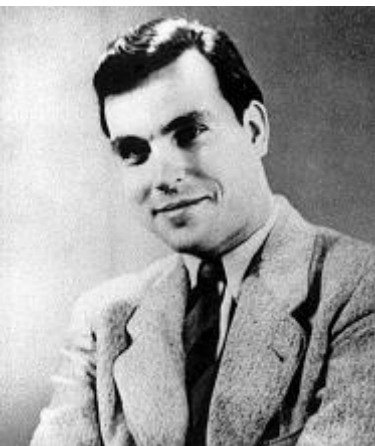
«HELLE» Der 20-jährige Helmut Kohl geht bei Wahlkämpfen keiner Keilerei aus dem Weg und wird Rudelführer seiner pfälzischen CDU.